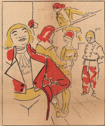
Danton mellem Brandmænd og Maskinakkiverakter.

Der arbejdes virkelig med stor Energi paa at have fransk Film til sin tidligere Højde — og da Bestræbelserne skyldes Enthusiasm, tror jeg, de vil lykkes. Det er ikke i Frankrig, men som det for nogle Aar siden var i Tyskland. Ogsaa der levedes Industrien af en nægtig Energi, med sin Drivkraften var kun Lynt til at imponere. Tilslut om at kunne Men Gænge af den Tids Film, der ledaagende af at nye Reklamemærkel, blev atstande som Monumenter. Dertil var de for brutale