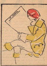
Robespierre læser en Artikel om Anundens Nordpolstyvning.

Der er fortumlet, med oprøve Nerve forladte Atleter, ser jeg i Forstuen de 'Saarøe' forsmat. I den Grad er Krigsere blevet paavirket af Kampens Hede, at de har læstet sig lange Flænger, Riber og dybe Saar. Billedet flyver. To Stiggelejer gaar rundt og anlægger Forbindinger, i et af Direktørens Værelser modtager en Læge de værste mdtagte. Gance selv skænder dem fremfødelig lig i den Bank. Men jeg banker engang et have læst en Reklamebroschur for Griffith-Filmens 'Autolantoren'. Efter en Oprensning af, hvor mange Millioner Dollars der var medtaget, hvor mange Kilometer Dybs Dokumentatione havde, hvor mange Handrolister Møder der var blevet brugt, og hvor mange Tusinder Statister der havde medvirket, stod der til Slutning ganske